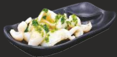
121 SÉPIA AMB ALLS JULIVERT