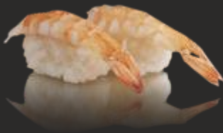
52 Nigiri llagostins(2u)