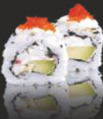
79 HAWAIROLL MAKI (4u)