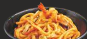
45 Yakiudon amb marisc i verdures