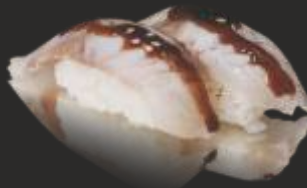
57 Nigiri llobarro(2u) flamejat