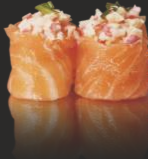
48 SAKE KANI(2u) GUNKAN