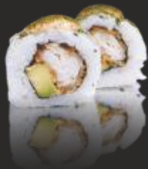
77 TORINIKU MAKI (4u)

Pollastre, alvocat, amb maionesa picants