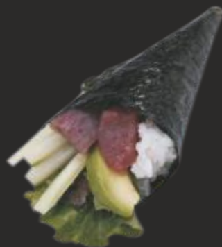
91 TEMAKI TONYINA(1u)