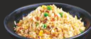
42 Arròs fregit amb salsa satay