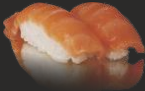
49 Nigiri salmó(2u)