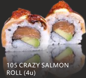
105 CRAZY SALMON ROLL (4u)