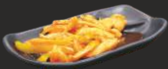
40 Pollastre amb salsa agredolç picant