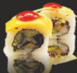
87 Mango vegetal (4u)