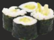
73 MAKI COGOMBRE (4u)