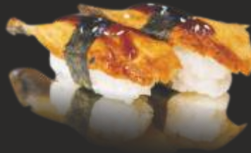
98 UNAGI NIGIRI (2u)