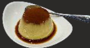
128 Flan de matcha