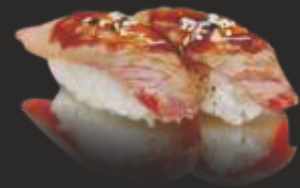
58 Nigiri tonyina(2u) flamejat