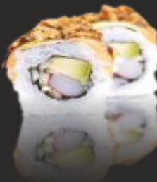
84 URAMAKI SALMON ROLL(4u)