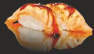
55 Nigiri salmó flamejat (2u)