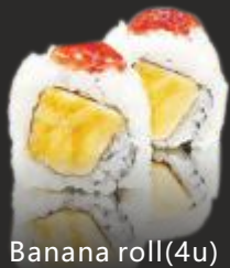
85 Banana roll(4u)