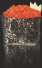
66 TOBIKO GUNKAN (2u)