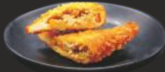
114 PA CURRY (2u)