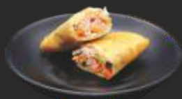
13 Rotllet de vietnamita amb porc (1u)