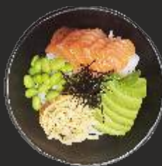
69 POKE SAKE GUNKAN