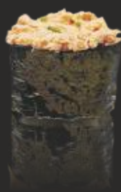
63 TUNA GUNKAN GUNKAN (2u)