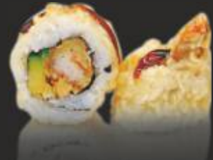
109 TEMPURA EBI ROLL (4u)