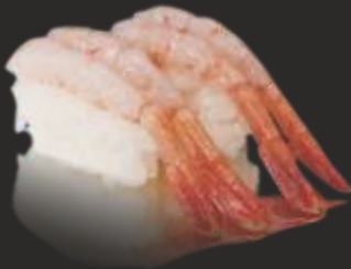
97 AMA EBI NIGIRI (2u)