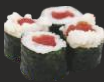
72 MAKI TONYINA (4u)