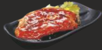
118 XAI AMB SALS YAKINIKU (1u)