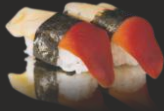
99 HOKKIGAI NIGIRI (2u)