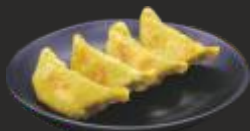
17 Gyoza vegetals(4u) 5.95€