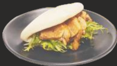
21 Bao amb anec(1u)