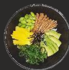
70 POKE VEGETAL GUNKAN