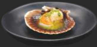
119 VIEIRES AMB SALS ALLS JULIVERT (1u)