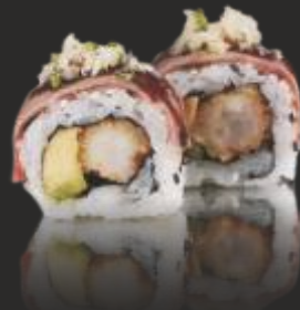
111 MAKI TERNERA (4u)