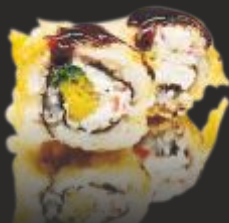
86 tempura hawaiiroll(4u)