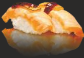
56 Nigiri salmó amb(2u) formatge