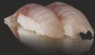
51 Nigiri llobarro(2u)