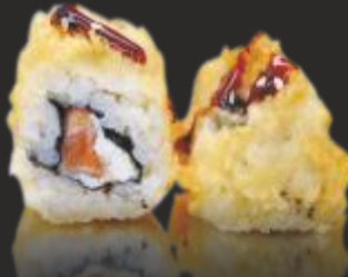
108 TEMPURA PHILADELPHIA ROLL (4u)