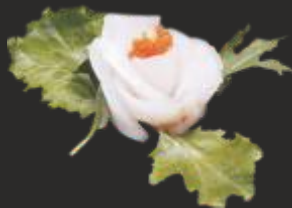
101 SASHIMI LLOBARRO (3u)