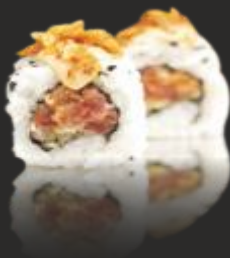
81 SPICY TUNA ROLL (4u)