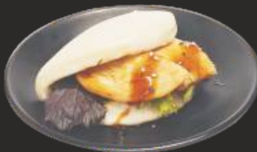
22 Bao amb filet de pollastre(1u)