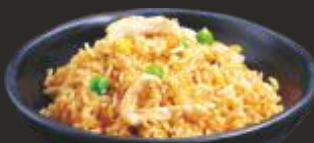
41 Arròs fregit amb pollastre