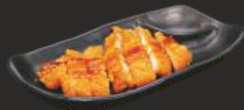
37 Porc arrebossat amb salsa tonkatsu