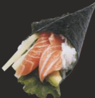
90 TEMAKI SALMÓ(1u)