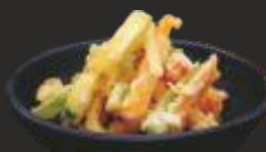
15 Tempura vegetals