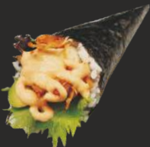
92 TEMAKI TONIRIKU (1u)