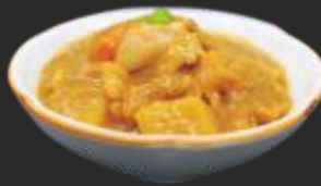
120 POLLASTRE AL CURRY