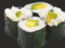
74 MAKI ALVOCAT (4u)