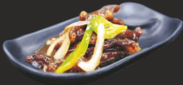
122 VEDELLA AMB SALS DOLÇA POC PICANT