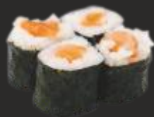
71 MAKI SALMÓ (4u)