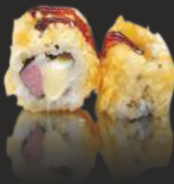
83 TEMPURA MOZZARELLA (4u)