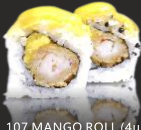
107 MANGO ROLL (4u)

Tempura de llagostins, alvocat, salmó tonyina