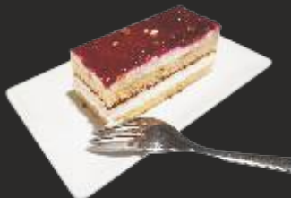
130 Queso Arandano