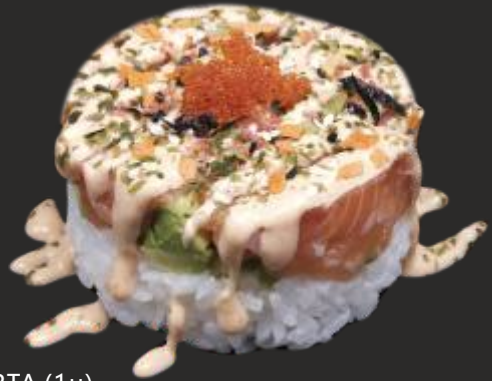
94 SAKE TARTA (1 u)

AQUESTS PLATS NOM' ES ELS SERVIM CAPS D SETMANA, NITS I FESTIUS