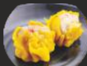
19 Saumai porc(2u)