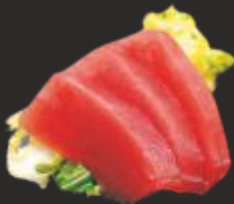
100 SASHIMI MAGURO (3u)