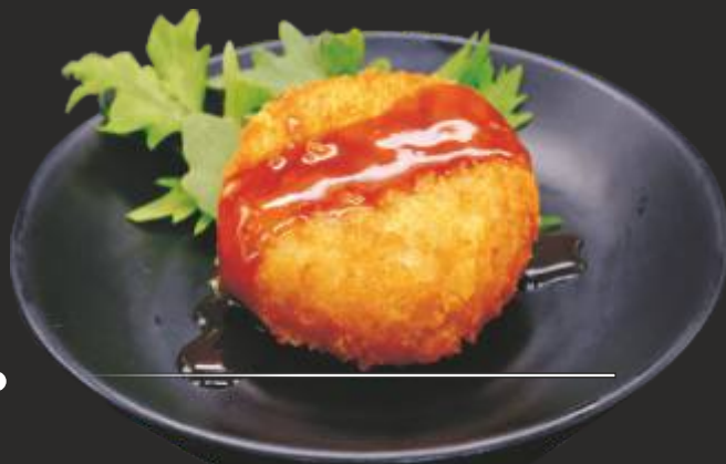
24 Korokke vedella (1u)