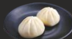
20 Bao amb porc (2u)