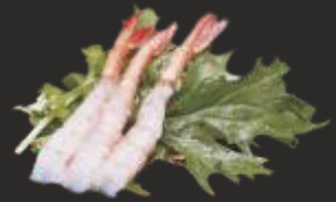
103 SASHIMI AMA EBI (3u)