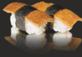
53 Nigiri tofu dolça(2u)