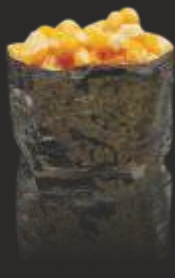
62 MAIS GUNKAN GUNKAN (2u)