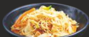
46 Fideus d'arròs amb pollastre i verdures