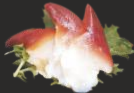
102 SASHIMI HOKKIGAI (3u)