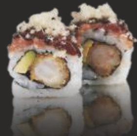
112 MAKI ATUN(4u)