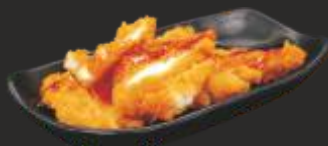
36 Pollastre arrebossat amb salsa tonkatsu