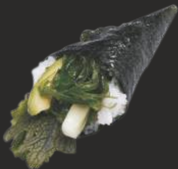
89 TEMAKI WAKAME(1u)