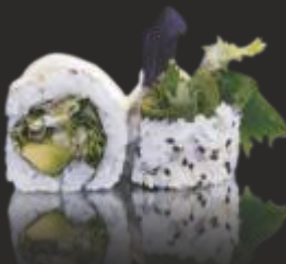
80 VEGETABLE ROLL (4u)