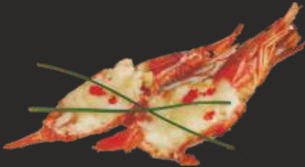
116 GAMBES AMB FORMATGE (2u)