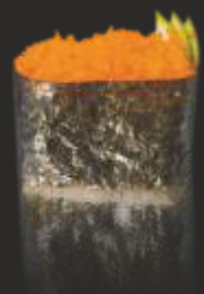
65 MASAGO GUNKAN (2u)