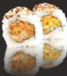
82 SPICY SALMON (4u)