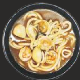
47 Curry udon amb marisc