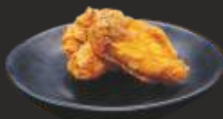
18 Aletes de pollastre fregides (2u)