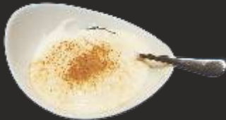
127 Crema de limon