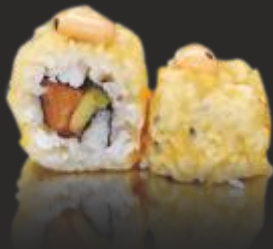
110 TEMPURA CRAZY SALMON ROLL (4u)