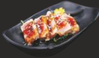
117 MAGURO TATAKI(5u)