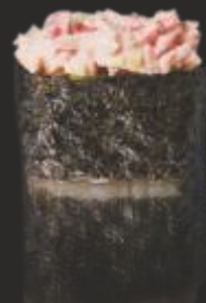
64 KANI GUNKAN (2u)