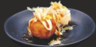
115 TAKOYAKI POP (2u)