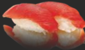
50 Nigiri tonyina(2u)