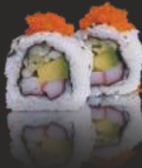
78 CALIFORNIA MAKI (4u)

Pollastre, alvocat, amb maionesa picants