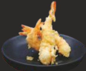
113 EBI TEMPURA (3u)