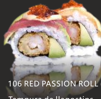
106 RED PASSION ROLL (4u)

Tempura de llagostins, alvocat, salmó tonyina