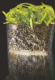
61 WAKAME GUNKAN (2u)