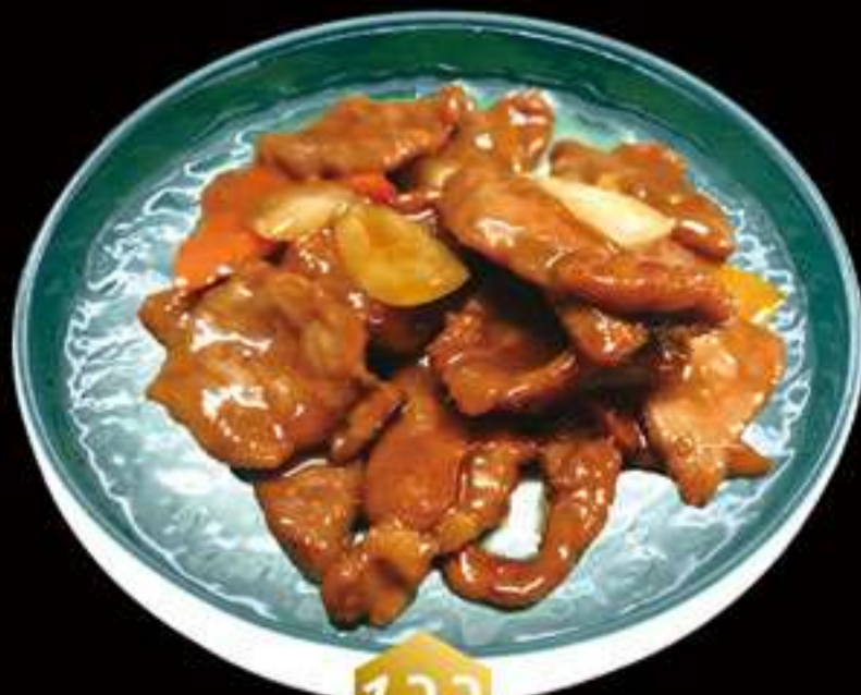
122 Ternera con salsa jingjiang Vedella amb salsa jingjiang