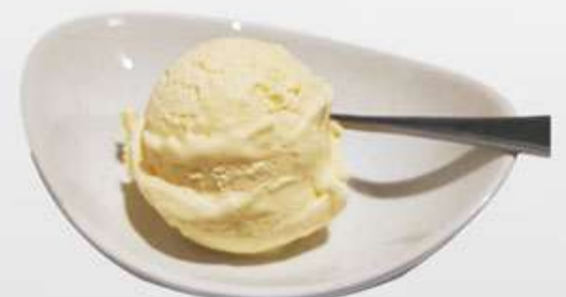
P4. Vanilla Vanilla