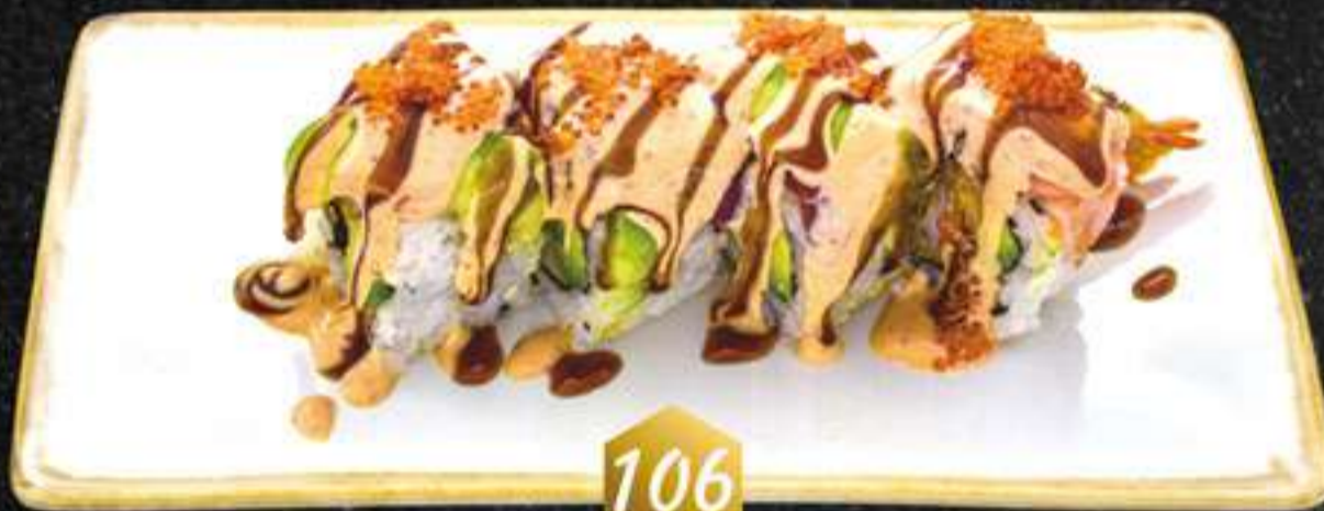
106 Rollo rojo pasión (4u) Rotlle vermell passió (tempura de langostinos, aguacate, salsa kawasaki, salsa anquila, tobiko)