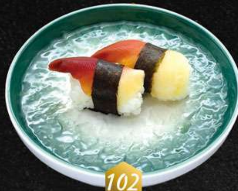
102 Nigiri hokkigai (2u) Nigiri hokkigai