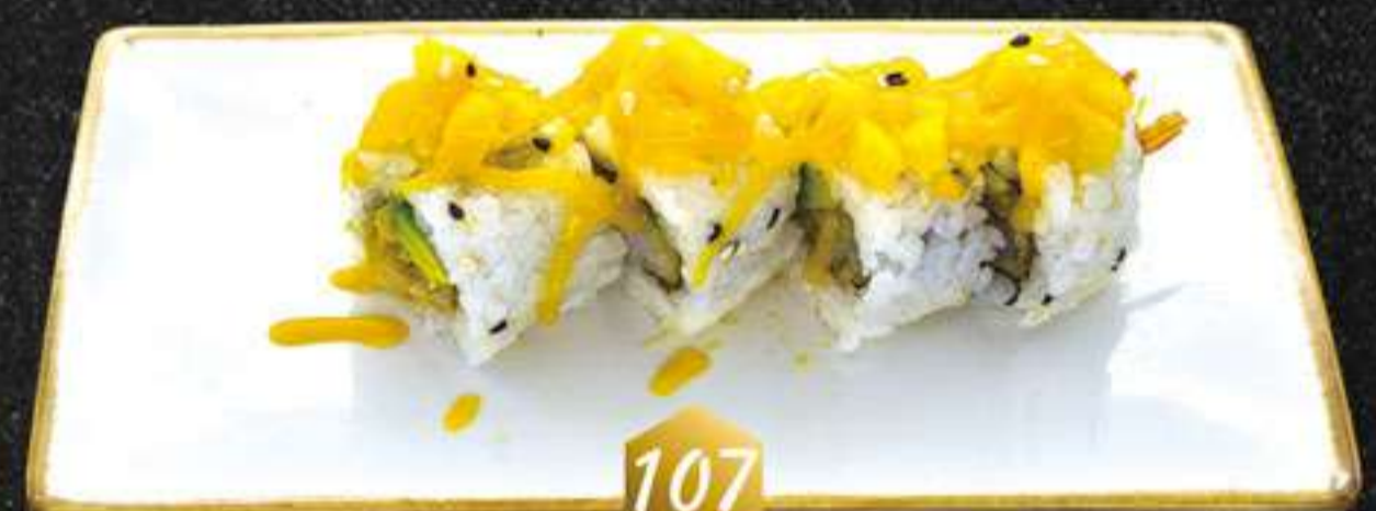
107 Mango roll (4u) Màneg roll (tempura de langostinos, mango y salsa mango)