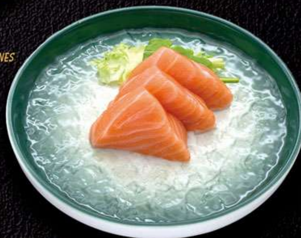
94 Salmón aji amarillo (3u) Salmó aji groc