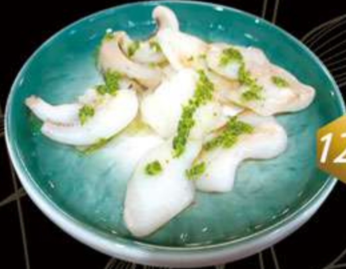
121 Sepia con ajos perejil Sepia amb alls julivert