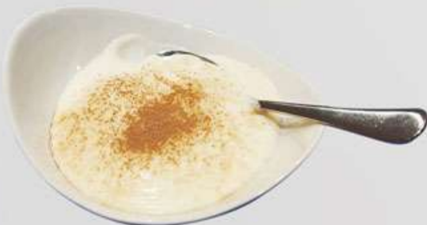
P5. Crema de Limón Crema de Llimona