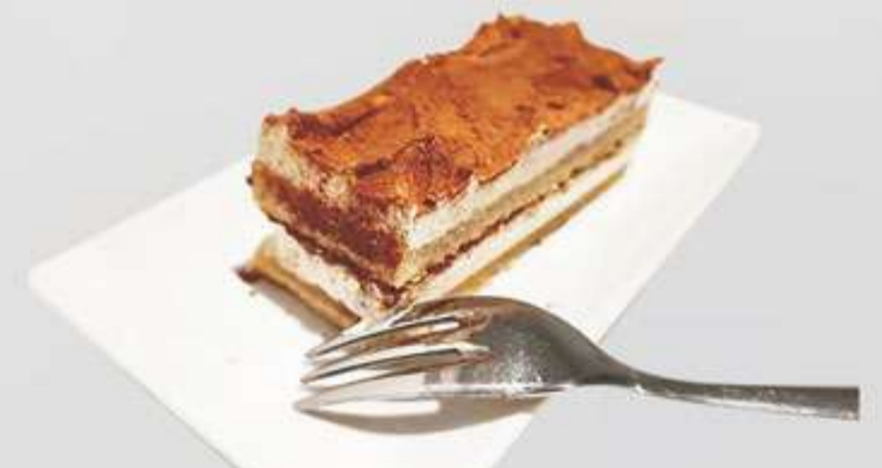
P7. Tiramisu Tiramisu