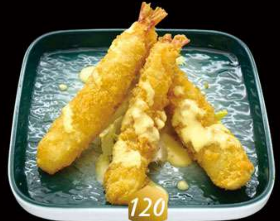
120 Ebi tempura (3u) Ebi tempura (3u)