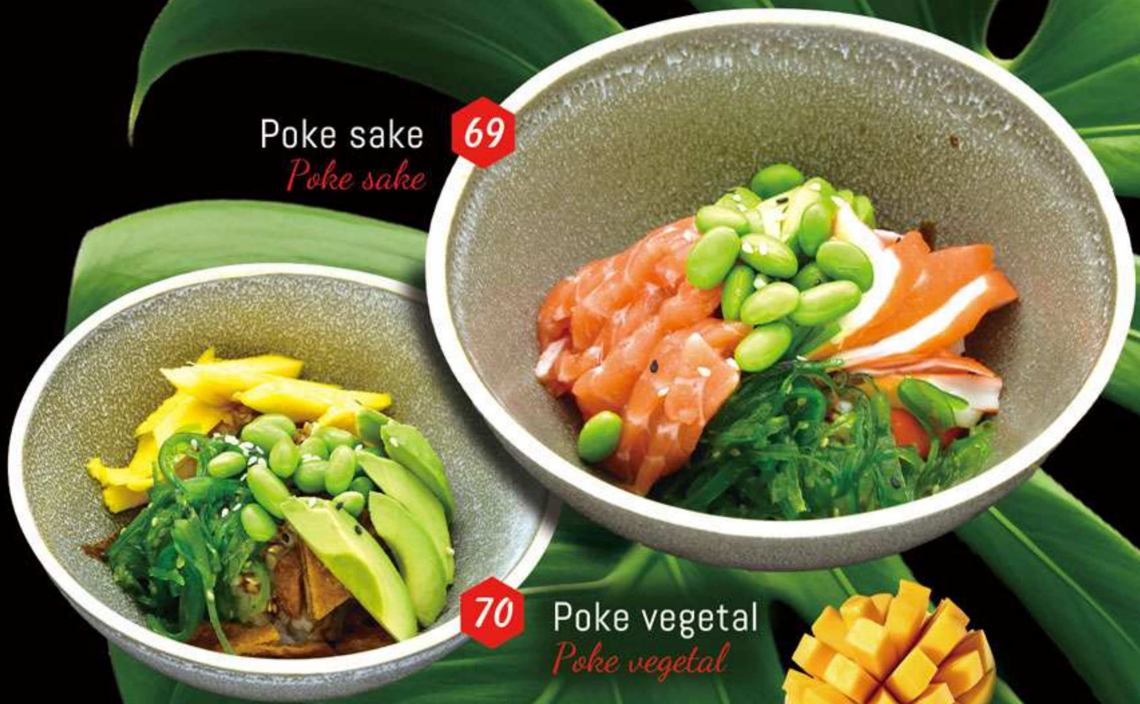
Poke sake 69 Poke sake