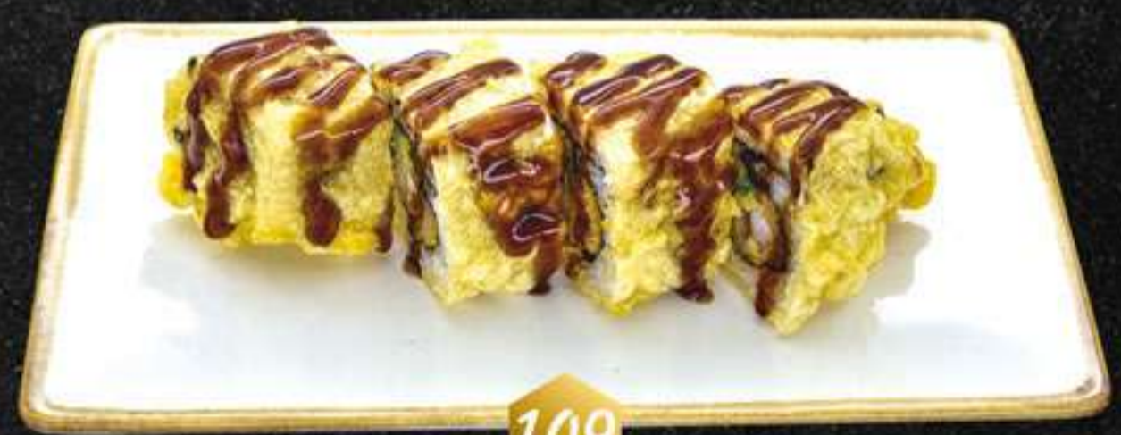
109 Tempura ebi roll (4u) Tempura ebi roll (tempura de langostinos, aguacate, salsa anguila)