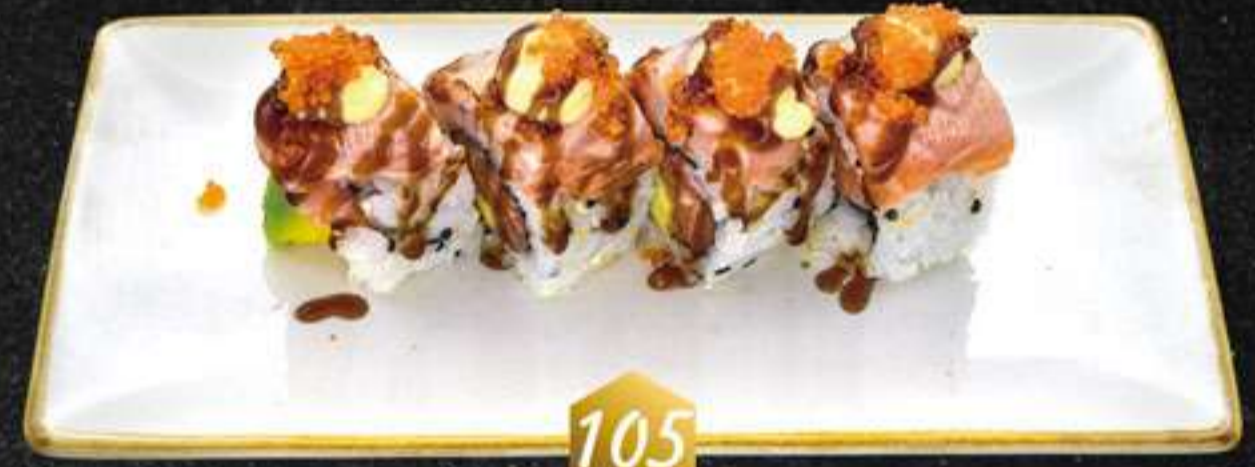
105 Crazy salmón (4u) Crazy salmó (salmón, aguacate, mayonesa, salsa anguila, tobiko)