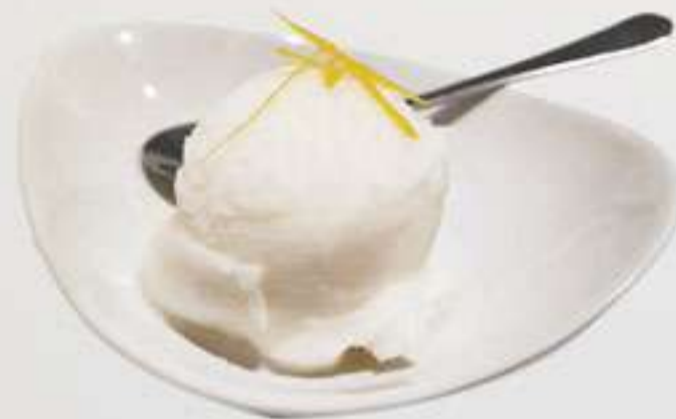
P3. Limón Llimona