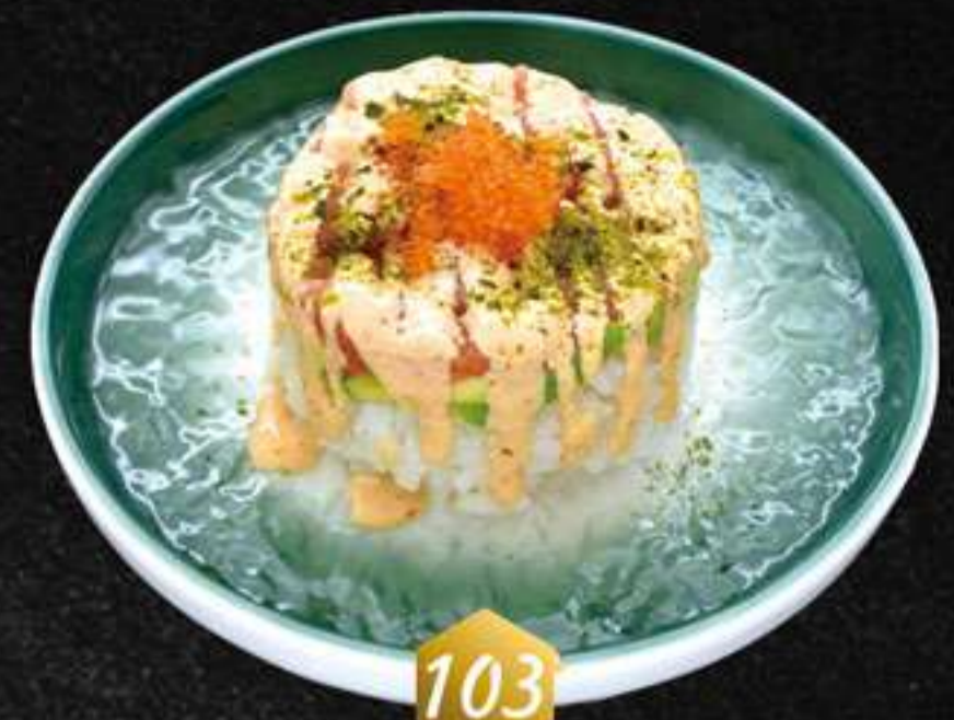
103 Sake tartar (1u) Sake tartar (1u)