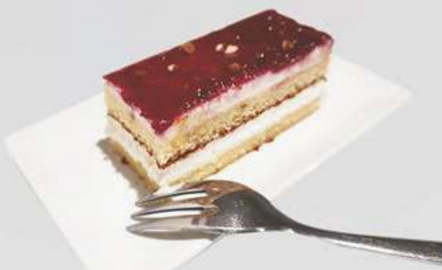
P8. Queso Arandano Formatge Arandano