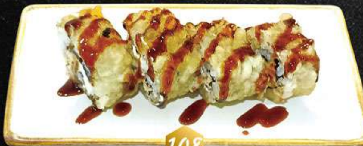
108 Rollo de tempura Filadelfia (4u) Rotllo de tempura Filadèlfia (salmón, queso, salsa anguila)