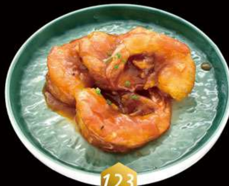
123 Langostino con salsa ajos Llagosti amb salsa ajos