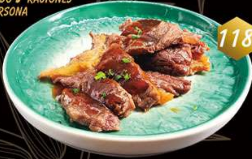
118 Entrecot con salsa pimienta negra Entrecot amb salsa pebre negre