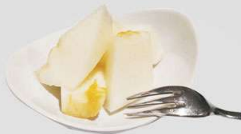
P9. Melón Meló