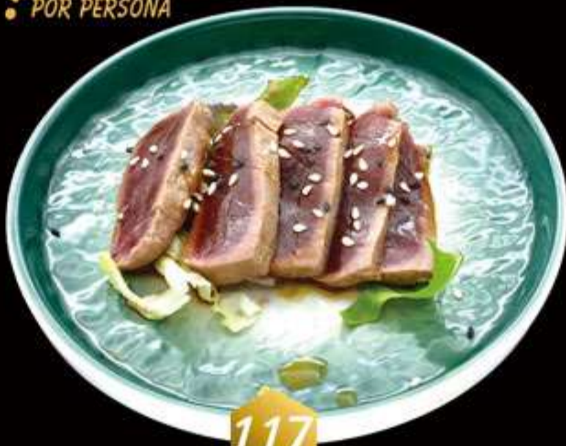
117 Maguro tataki (5u) Maguro tataki (5u)