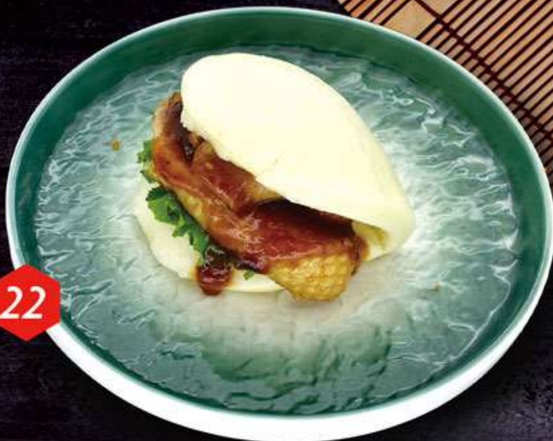
Bao con pato (1u) Bao amb anec (1u)