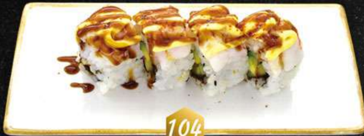
104 Ebi uramaki flameado (4u) Ebi uramaki flamejat (pepino, aguacate, surimi, langostinos, mayonesa, salsa anguila, masago)