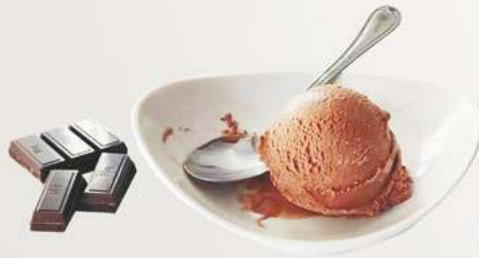
P1. Chocolate Xocolata