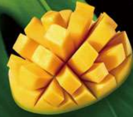
Poke vegetal 70 Poke vegetal