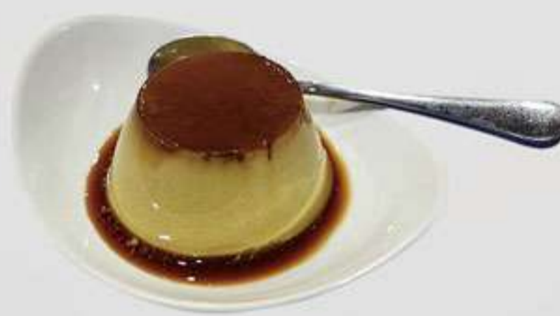
P6. Flan de matcha Flam de matxa