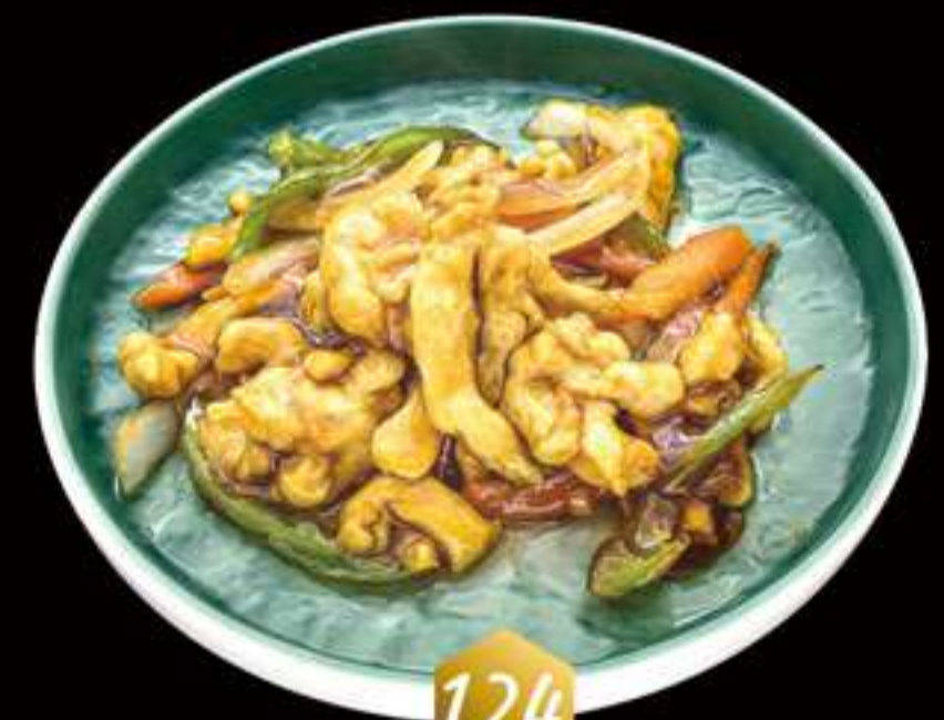
124 Pollo con salsa yuxiang Pollastre amb salsa yuxiang