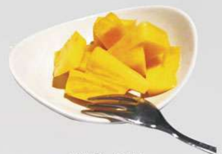
P10. Piña Pinya

Los postres están limitados a un pedido por persona. Les postres estan limitades a una comanda per persona.