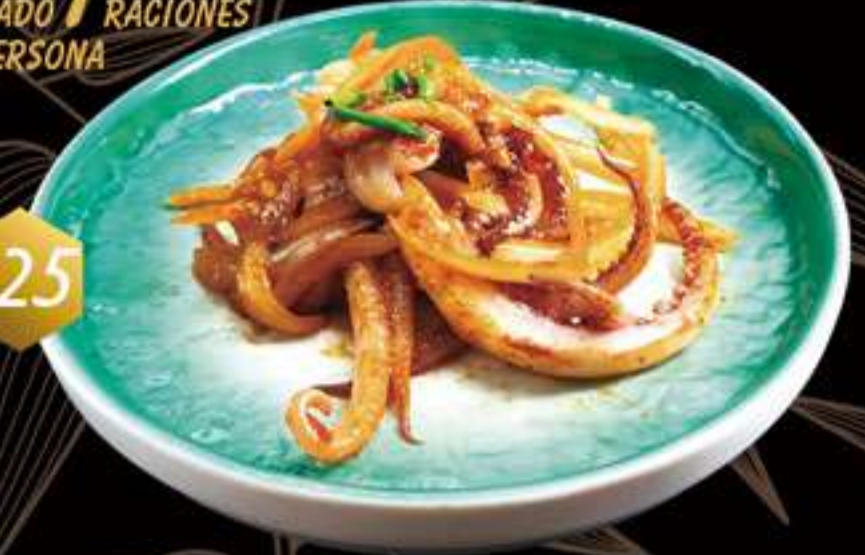
125 Rejos a la plancha con salsa picante Rejos a la planxa amb salsa picante